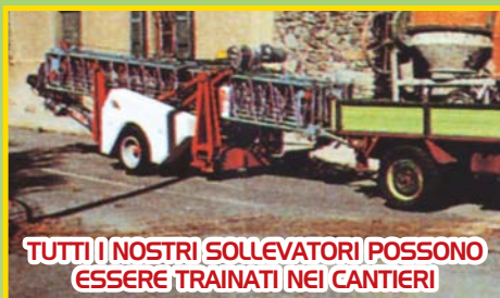
TUTTI I NOSTRI SOLLEVATORI POSSONO ESSERE TRAINATI NEI CANTIERI

La Cinomatic S.r.l. è certificata ISO 9001:2000 ICIM SISTEMA DI QUALITÀ